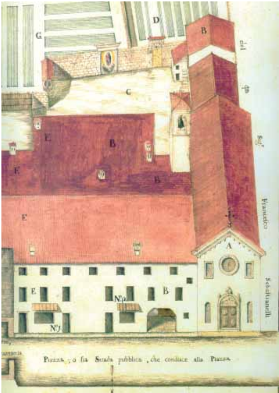
Ospedale di San Vito al Tagliamento: Catastico del XVIII secolo (Fondazione Falcon-Vial)