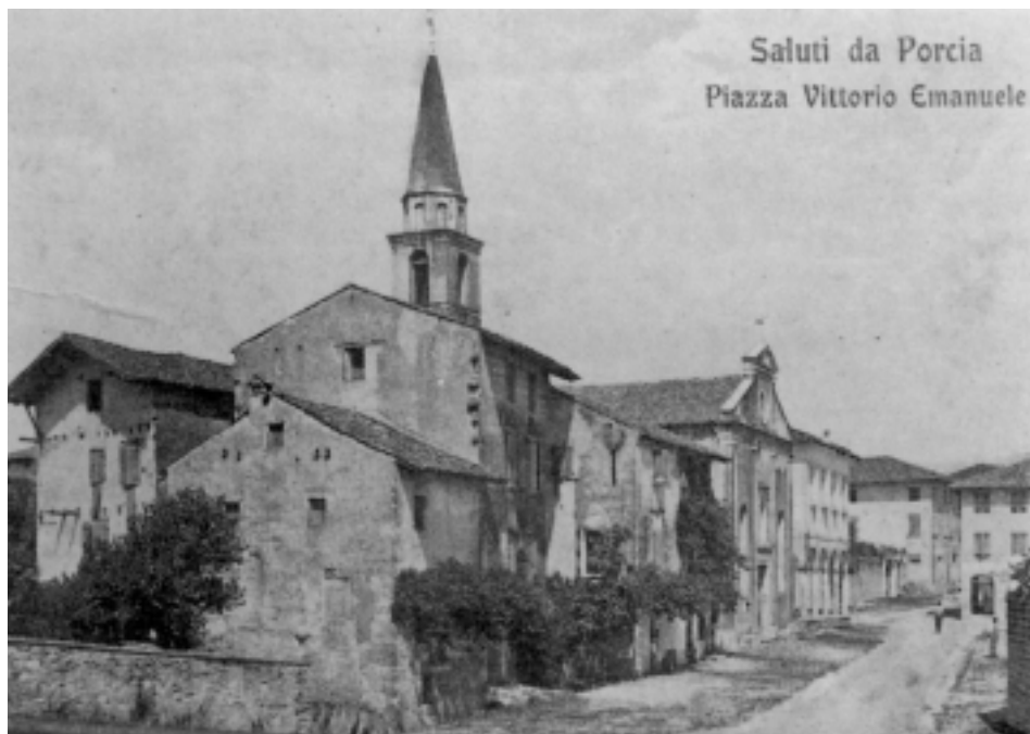
Veduta della vecchia Porcia, con in primo piano l'ospedale e la sede della confraternita.

atto a ospitare qualcuno e a occuparsi di lui, ma non propriamente a curarlo: una struttura, quindi, più ecclesiastica che medica» 37 . Prima di specializzarsi nell'assistenza agli ammalati, verso la fine del medioevo, gli ospedali servirono soprattutto come luoghi di ricovero per poveri e pellegrini ed è interessante notare che nella Destra Tagliamento esisteva una fitta rete di strutture di tale tipo poste lungo la strada pedemontana, presso i guadi, gli scali fluviali e i principali nodi viari 38 .