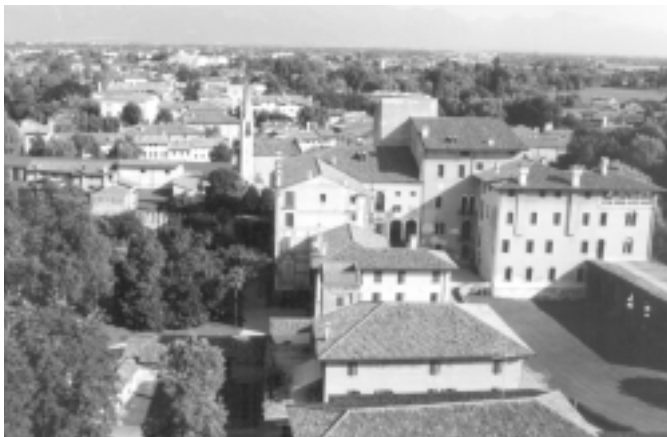
Veduta dell'area castellana di Porcia e del borgo.

Uno dei fattori che hanno contribuito alla nascita del centro abitato, e in particolare del borgo principale sviluppatosi lungo l'attuale via Roma, sono state indubbiamente la confraternita dei Battuti e la chiesa di Santa Maria, per secoli elemento di