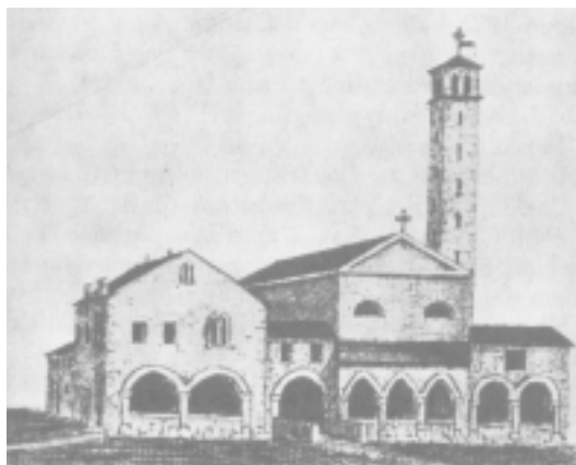
Spilimbergo, Chiesa di San Giovanni Battista ed Ospedale in una stampa dell'Ottocento.

Si è già detto del motivo per cui sorse l'ospedale dei Battuti di Spilimbergo, cui fu annessa nel 1326 una chiesa dedicata a San Pantaleone. Nel 1342 subentrarono nella struttura i Frati Eremitani di Sant'Agostino e i Battuti costruirono un'altra Chiesa, con annesso ospizio, dedicata a San Giovanni Battista 7 , nella quale è possibile ancor oggi ammirare, nonostante la radi-