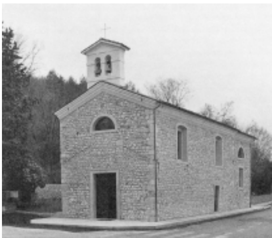
Grizzo, Chiesa di Santa Maria, detta La Fradese.

Un altro piccolo ospedale si trovava a Porcia, nel pian terreno di una casa ubicata probabilmente presso la chiesa di Santa Maria. Sembra che potesse ospitare da quattro a dodici persone, assistite, fino al XIX secolo, da un priore e da una fantesca: il medico era chiamato solo in caso di necessità. Era governato dal gastaldo della locale confraternita dei Battuti, il quale era obbli-