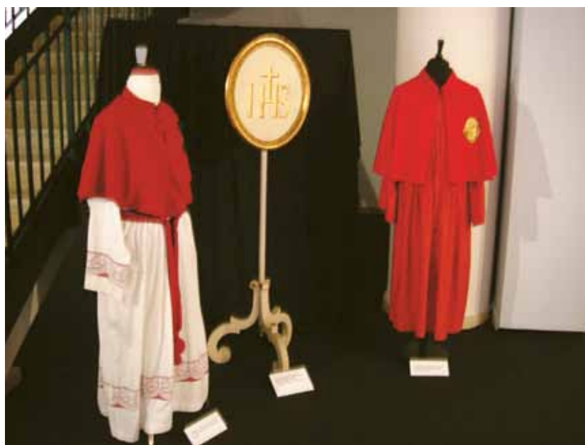
Cappe della confraternite del Santissimo Sacramento del Santuario di Santa Maria delle Grazie di Pordenone.