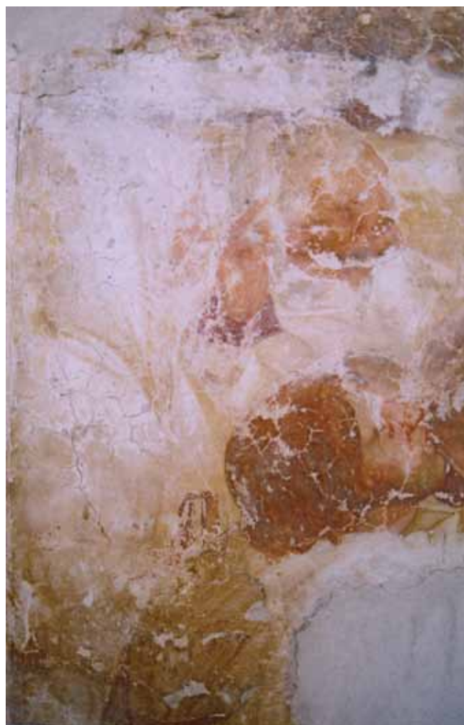
Pellegrino da San Daniele, particolare della Processione dei Battuti , in cui si nota la presenza di un flagello, inizi sec. XVI, Piazza Duomo, Sacile.

L'azione di questi sodalizi fu continuata dal movimento dei Battuti, una nuova forma di aggregazione laicale nata dall'asceta e predicatore perugino Raniero Fasani, ancora più stringente di quelle antiche, che divenne nei secoli successivi la più importante e longeva forma di confraternita. Sulla diffusione dei Battuti in Friuli è nota la narrazione di Giuliano Canonico di Cividale, il quale fu testimone dei clamorosi fatti accaduti nella seconda metà del XIII secolo: Nell'anno del Signore 1260, nella festa di sant'Andrea, il Signor Aquino, decano d'Aquileia, insieme ai penitenti che si frustavano sulla pelle nuda venne innanzitutto a Cividale. E subito i Cividalesi iniziarono anch'essi a flagellarsi; così che nel giro di una