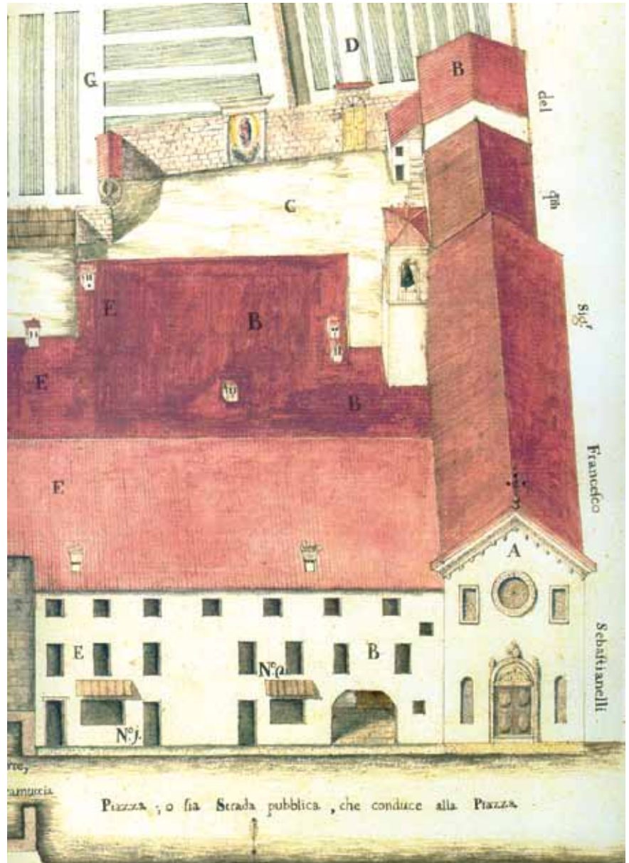
Ospedale di Santa Maria dei Battuti di San Vito al Tagliamento (Catastico, XVIII secolo, Fondazione Falcon-Vial).

notevole impegno nel reperimento delle informazioni e dei dati in numerosissimi contratti di vendita e locazione, tra XV e XVIII secolo 31 ; manca quasi del tutto nelle ricerche la problematica del rapporto tra confraternite, ceti dirigenti ed autorità politiche, sia per quanto riguarda l'età medievale che per l'età moderna 32 ; infine occorre continuare ad indagare a fondo il tema della committenza delle opere d'arte, dove le confraternite hanno svolto un ruolo decisivo, non ancora ben delineato 33 . Il percorso per comprendere meglio l'opera delle confraternite è dunque ancora lungo, ma esso permetterà di conoscere meglio anche le vicende di un territorio la cui vitalità trae ancora alimento in secoli di associazionismo e solidarietà.