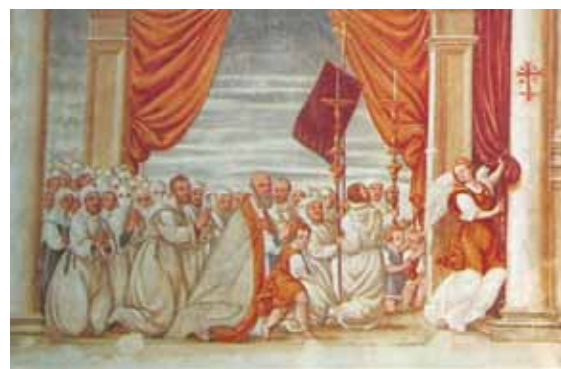
Giuseppe Furnio, Contemplazione dei Misteri della vergine , seconda metà sec. XVI, Chiesa di Santa Maria Assunta di Blessaglia.