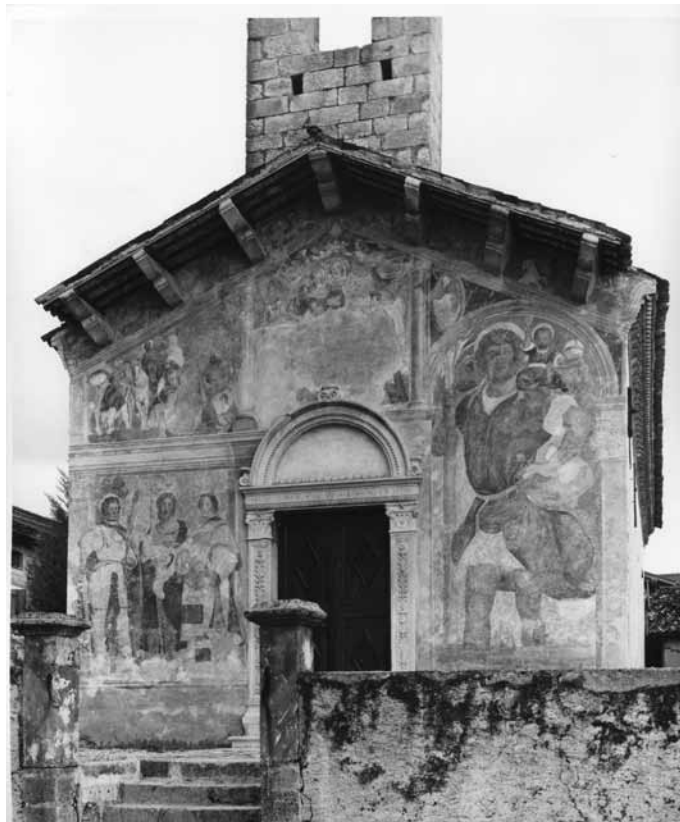
Giovanni Antonio de' Sacchis, decorazioni a fresco della facciata dell'Oratorio di Santa Maria dei Battuti, 1524, Valeriano.

legislazione austro-ungarica di Giuseppe II, che già nel 1783 aveva abolito le confraternite religiose nei territori imperiali, e con quella di Leopoldo II, che le sopprime in Toscana nel 1785. Lo Stato Unitario italiano, dopo l'annessione del Friuli nel 1866, continuò nelle politiche di confisca dei beni confraternali, tanto che solo nel