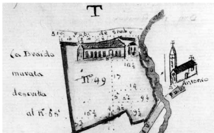
La chiesa di Sant'Antonio Abate, Udine, Archivio di Stato, CRS, Cordenons, Sant'Antonio Abate (fraterna), b. 197, fasc. 4, 1778.

strutture diocesano-parrocchiali della Chiesa. Secondo l'attuale Diritto Canonico i fedeli hanno il diritto di costituire associazioni, mediante un accordo privato tra di loro per conseguire i fini di cui al canone 298, fermo restando il disposto del can. 301 (Can. 299), dove i fini sono l'incremento di una vita più perfetta, la promozione del culto pubblico o della dottrina cristiana, o altra opere di apostolato, quali iniziative di evangelizzazione, esercizio di opere di pietà o carità, animazione dell'ordine temporale mediante lo spirito cristiano; mentre il disposto è che spetta unicamente all'autorità ecclesiastica competente erigere associazioni di fedeli che si propongano l'insegnamento della dottrina cristiana in nome