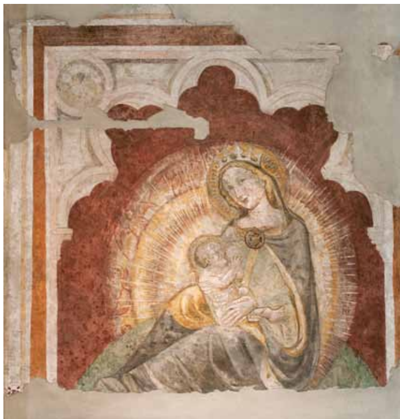
Madonna degli Angeli, prima metà sec. XIV, Chiesa del Cristo, Pordenone.

Nell'età moderna le confraternite sono state anche protagoniste della resistenza al dilagare delle eresie e in particolare della riforma protestante, soprattutto nell'arco alpino. Spesso gli aderenti all'associazione coincidevano con gli abitanti dell'intero villaggio, che si educavano alla vita cristiana attraverso la ripetizione dei gesti, delle pratiche e delle devozioni coltivate fedelmente nel tempo, come attraverso l'esempio e la correzione reciproca. Significativo anche qui il caso